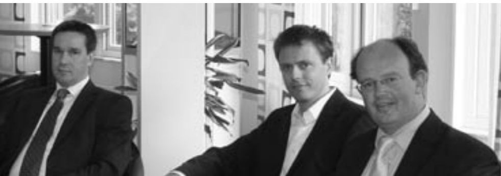
Skånes Innebandyförbunds styrelse