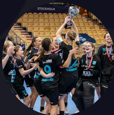
F14 Järfälla Bele IBK