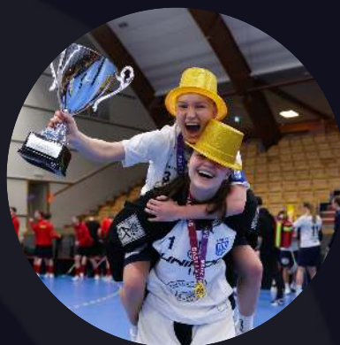
DJ Täby FC