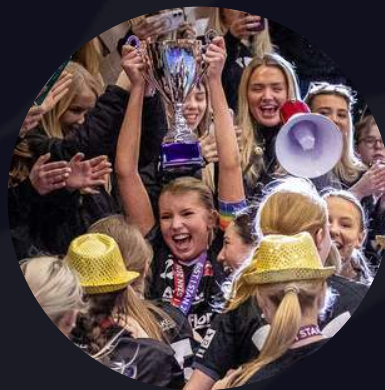
F15 Tyresö Trollbäcken IBK