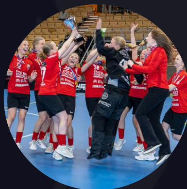
F16 Storvreta IBK