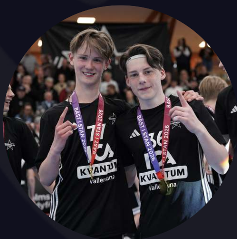
P14 Vallentuna IBK

Stort grattis till samtliga mästare och ett varmt tack till alla lag, funktionärer och besökare som tillsammans bidrog till en väl genomförd och uppskattad finalhelg.