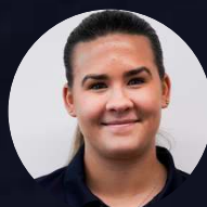
Sofia Wrangle Ekonomi Deltidsanställd