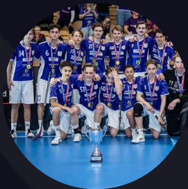
P15 Salems IF