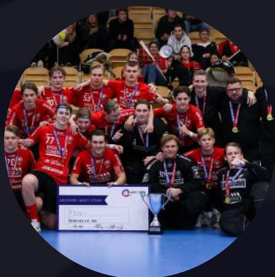
HJ Storvreta IBK