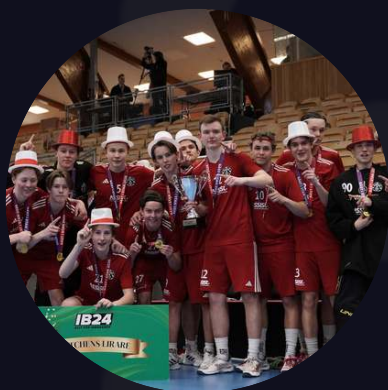
P16 Huddinge IBS