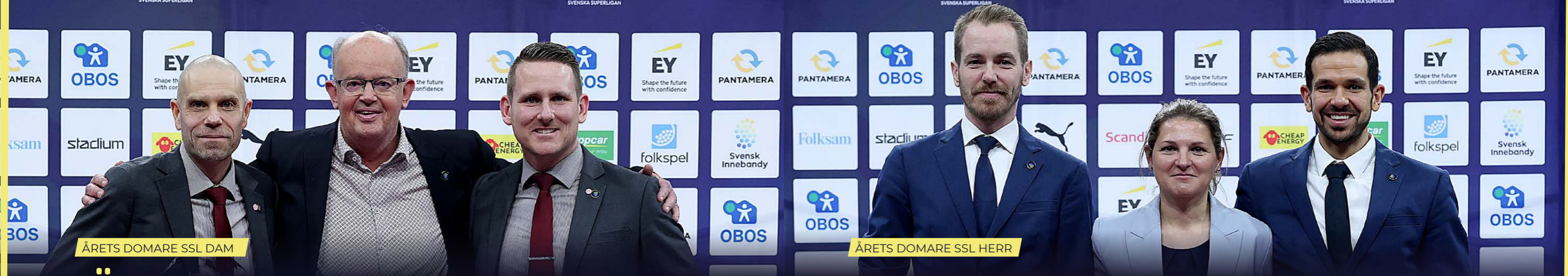
ÅRETS DOMARE SSL DAM