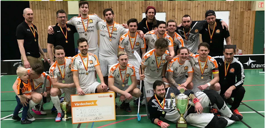
Höllvikens IBF - Skånemästare på herrsidan säsongen 2018/19