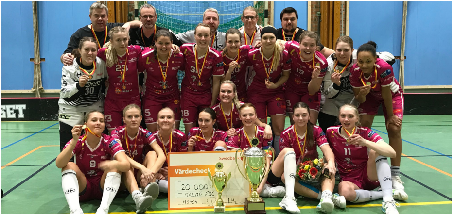
Malmö FBC - Skånemästare på damsidan säsongen 2018/19