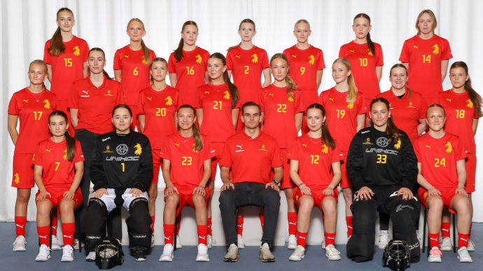
Distrikts-SM Skåne F16 Säsongen 2026

Vi har fortsatt utveckla träningsinnehållet och den röda tråden mellan åldersklasserna. Mer fokus har lagts på passningar- och mottagningar i fart samt moment som kräver mer maxlöpningar. En stor del av analysen som ligger till grund för planeringen kommer från spelarutvecklingsträffar med utvalda ledare under säsongen. Nästa steg är att utveckla målvaktinnehållet och fler teoretiska inslag.