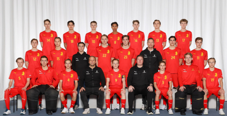
Distrikts-SM Skåne P16 Säsongen 2026