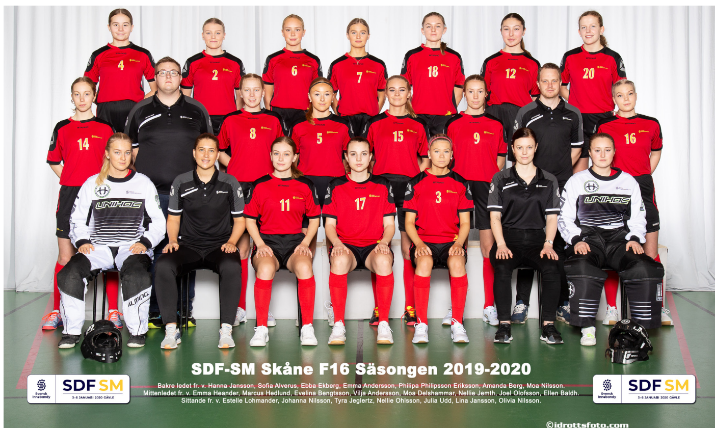
SDF-SM Skåne F16 Säsongen 2019-2020